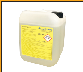
Inhalt 5 Liter