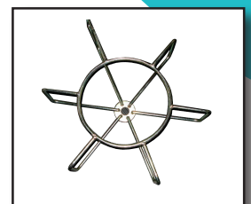
Spiralkorb SK16 / 22 / 32 Art. 45.070 / 45.071 / 45.072