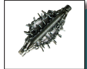
Kettenschleudern in versch. Ausführun- gen und Kupplungen