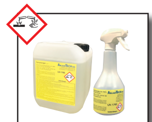
Spiral-Reinigungsmittel Art. 95.340