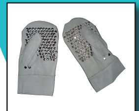
Führungshandschuh Art. 45.095