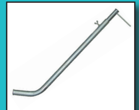
Spiralführungsrohr Länge 1-2m Art. 36.301