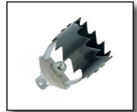
Wurzelschneider versch. Grössen und Kupplungen